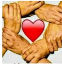
Mayores en Acción